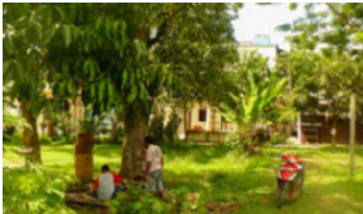
De plek in Sorong, waar nieuwe gebouwen voor het onderwijs aan de SION KIDS gebouwd zullen worden.

Ik sprak over het meisje dat door Syrische soldaten geschaakt was, en wreed werd losgescheurd van het hart van vader en moeder. Maar wat een zegen, dat haar ouders haar opgevoed hadden in de vrede des Heeren. De paar woorden, recht uit haar hart, die zij in het vreemde land sprak tot haar meesteres, had tot gevolg dat een Syrische generaal, door God genezen, getuigde: 'Nu weet ik dat er geen God is op de ganse aarde dan in Israël' (2 Kon. 5:15). De les van deze geschiedenis is: de meest verdrietige omstandigheden kunnen niet belemmeren dat een kind tot zegen voor anderen is. Het meisje bij Naäman was een van de 'Sion Kids'!