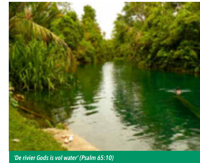
'De rivier Gods is vol water' (Psalm 65:10)

Toen Marthen Su mij november 2015 in Assen uitnodigde om een aantal weken naar Papua te komen, zei mijn hart onmid-