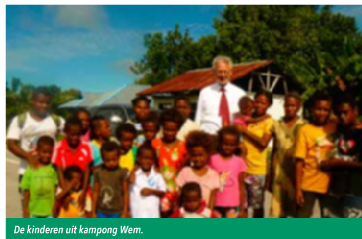
De kinderen uit kampong Wem.

De situatie van vandaag lijkt als twee druppels water op die in het boek Esther. De haat tegen de Joden neemt overall toe, vooral in het westen. Er is echter een heel venijnige en sluikse vorm van antisemitisme die als zodanig niet wordt onderkend. Anti-Sem betekent: anti de Naam van God. Heel veel mensen, ook in de kerken, verslijten de Bijbel voor een puur menselijk boek. Zij ontdoen het Woord van zijn openbaringskarakter. Als je de Bijbel meent te kunnen uitleggen zoals het je belieft, sta je gewoon op tegen God. En als er geen ontzag voor God ('vreze des HEEREN') meer is, is ook het ontzag weg voor alles wat aan Hem behoort. Het ontzag voor het huwelijk (van man en vrouw welteverstaan), het ontzag voor het prachtige leven in de moederschoot, het ontzag voor het volk van God, Israël, voor het land Israël en de stad Jeruzalem, en voor het hele plan van God. Het oude heidendom dat Hitler in zijn nazisme nieuw leven inblies, is allang en breed onder ons herleefd. We noemen het alleen anders, maar de atmosfeer vandaag is anti de God van Israël en anti de Messias als de komende Koning van Israël. De nood in ons land is heel groot. Ik heb meer dan eens tegen de Papua's gezegd: 'Jullie zijn rijk, wij zijn arm!'.