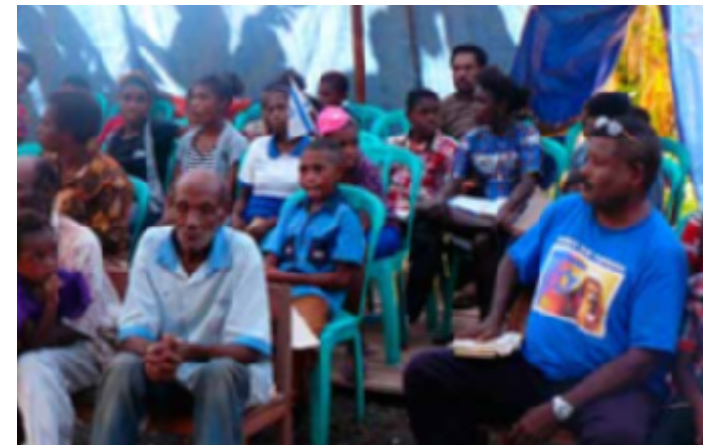
De mensen in Kunda luisteren aandachtig naar Gods Woord.

Activiteiten: o.m. Maandelijkse lezing en Israëlbidstond, Oude kerkweg 88 in Doornspijk elke 3e zaterdag v.d. maand, 14.30-16.00 uur.