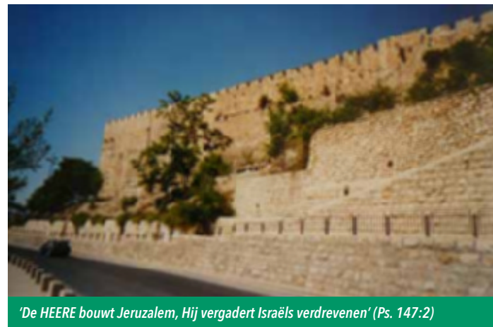
'De HEERE bouwt Jeruzalem, Hij vergadert Israëls verdrevenen' (Ps. 147:2)

Wij mogen ons bekeren. Van liefdeloosheid, van het wrede humanisme in wier handen het kind zelfs in de moederschoot niet veilig is! Van afgoderij, hoererij, ontrouw in het huwelijk, onbijbelse relaties die nimmer 'huwelijk' mogen heten, van schijnheiligheid, roddel, geldzucht, trots, hoogmoed, van...noem maar op. Heel de kerk en heel het volk staan bij God in het krijt. De gemeente van Christus voorop! Daarom is net nu de tijd dat het oordeel begint bij het huis van God. Als God nu