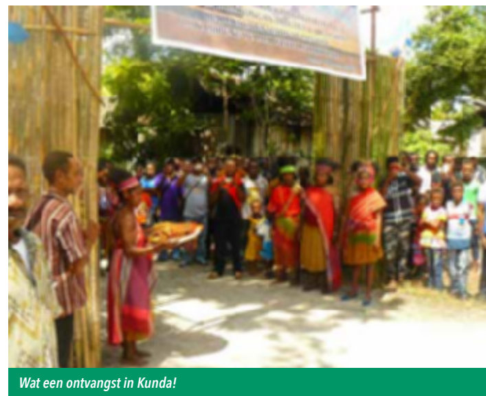
Wat een ontvangst in Kunda!

dwaas van die volken, die samenzworen om Israël en Jeruzalem van de kaart te vegen. Terwijl zij met hun biochemische wapens op Jeruzalem afsnellen, zal er verwarring ontstaan in het vijandelijke leger en...zij vallen in hun eigen zwaard ( Zacharia 14: 1-15 ). Met de wapens, bedoeld voor de vernietiging van Israël, vernietigen zij zichzelf! De grond rond Jeruzalem zal bezaaid